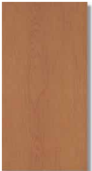
Sabika Cerezo 30 x 60 cm. W37 PEI III A43 Sabika Cerezo Rec 30 x 60 cm. W41 PEI III A48