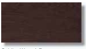
Sabika Wengé Rec 15 x 30 cm. HZD PEI III A61

La Alhambra, denominada así por sus muros de color rojizo («qa'lat al-Hamra'», Castillo Rojo), está situada en lo alto de la colina de al-Sabika, en la margen izquierda del río Darro. En esta colina existía una fortaleza muy antigua, tal vez del s. IX, y sobre ella el primer rey de la dinastía nazarí, llamado Alhamar, comenzó a construir la Alhambra. Era el año 1.239.