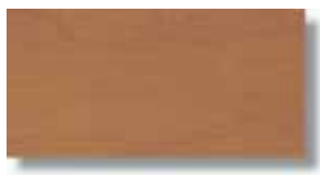
Sabika Cerezo Rec 15 x 30 cm. HZC PEI III A61