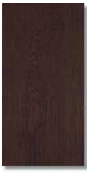
Sabika Wengé 30 x 60 cm. W38 PEI III A43 Sabika Wengé Rec 30 x 60 cm. W42 PEI III A48