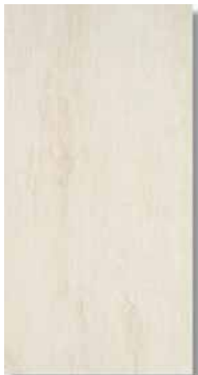
Sabika Blanco 30 x 60 cm. W36 PEI IV A43 Sabika Blanco Rec 30 x 60 cm. W40 PEI IV A48