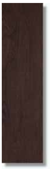
Sabika Wengé Rec 15 x 60 cm. HZG PEI III A61