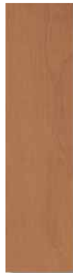
Sabika Cerezo Rec 15 x 60 cm. HZF PEI III A61