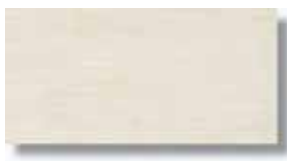
Sabika Blanco Rec 15 x 30 cm. HZB PEI IV A61