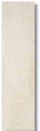
Sabika Blanco Rec 15 x 60 cm. HZE PEI IV A61